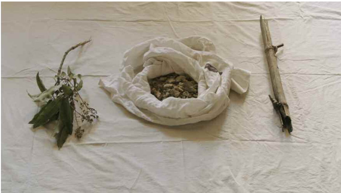
Rattana Vandy, MONOLOGUE , photogrammes, 2015.