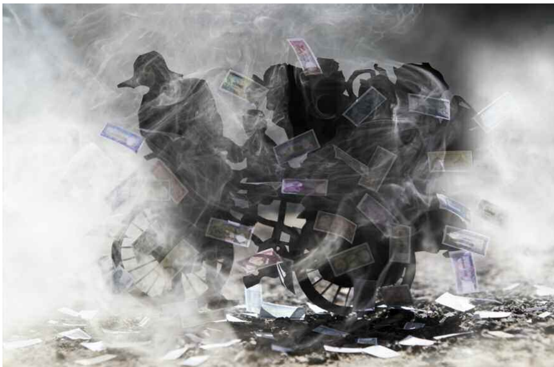
Remissa Mak, « Monnaie sans valeur » de la série Partis trois jours , papiers découpés, fumée et photographie, 2015.

Remissa Mak, né en 1970, travaille actuellement en tant que photojournaliste pour l'European Pressphoto Agency. En 2005, son exposition de photographies, intitulée d'après un proverbe traditionnel khmer : "When the water rises, the fish eats the ant ; when the water recedes, the ant eats the fish" [« Quand l'eau monte, le poisson mange la fourmi ; quand l'eau descend, la fourmi mange le poisson »], fut montrée dans des galeries de Phnom Penh, comme Popil et Java, ainsi qu'au Angkor Photo Festival. Sept de ses pièces ont été acquises par le Singapore Art Museum.