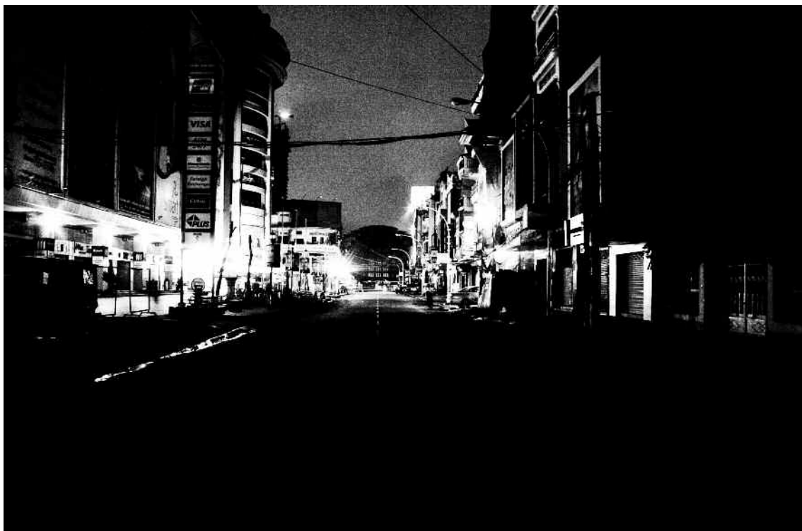
Raksmei Long, Ghost City , photographie, 250 x 375 cm, 2012.

Raksmei Long est un photographe, né en 1994 à Phnom Penh. Il étudie actuellement l'architecture à l'Université Royale des Beaux-Arts. En 2012, il a participé aux « Ateliers de la mémoire », organisés par Soko Phay et Pierre Payard au Centre Bophana dirigé par Rithy Panh. Les paysages urbains de « Ghost city » représentent une exploration nocturne de la ville de Phnom Penh. La cité déserte rappelle étrangement la ville évacuée de force par les Khmers rouges après sa chute le 17 avril 1975. Ses vues qui montrent des rues désertées, des bâtiments vidés de leurs habitants sont prises de telle manière qu'elles évoquent irrésistiblement la ville-fantôme qu'était la capitale sous le Kampuchéa Démocratique. Par cette superposition implicite, le jeune photographe montre que Phnom Penh est toujours habité par les spectres du passé.