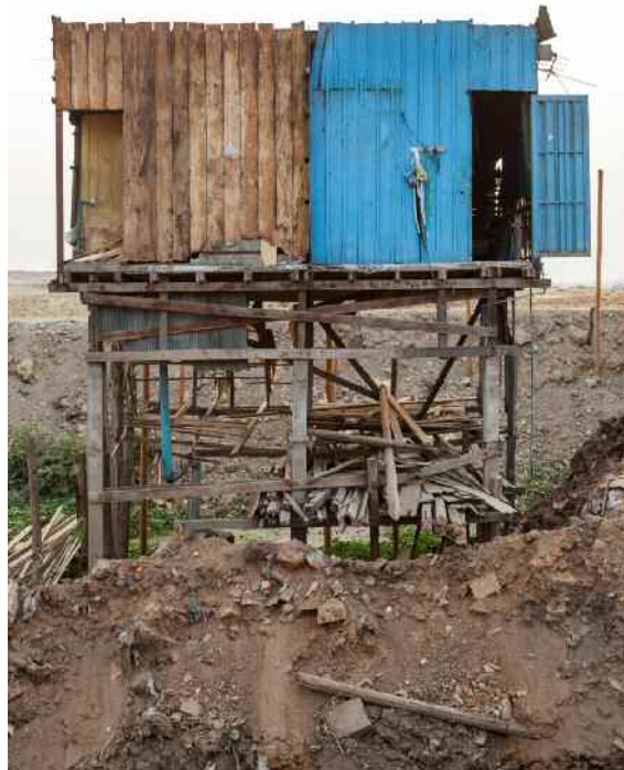
Sokchanlina Lim, National Road Number 5 , 2017.

La série « National Road Number 5 » de Sokchanlina Lim révèle comment l'Etat cambodgien a coupé la route N°5 en deux, afin de l'agrandir, sans considération pour les riverains. Depuis un an, il documente l'état des maisons coupées en deux et la manière dont jour après jour les gens les réparent et continuent à y vivre malgré tout. Chaque photographie est composée des mêmes cadrages serrés, transformant les habitats rafistolés de divers matériaux récupérés en paysage ou en nature morte.